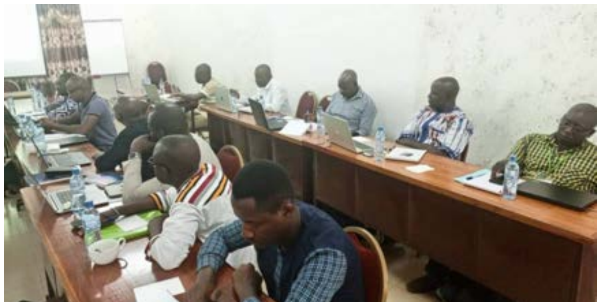
Les participants ont pu relever les points forts et les insuffisances des formations passées avant de faire des recommandations pour celles à venir

l'équipe opérationnelle du Consortium GAC et les inter collectivités ; toutes parties prenantes des sessions de formation.