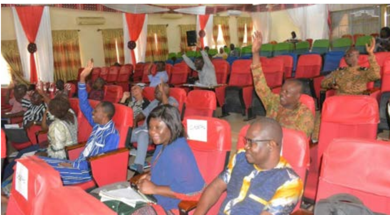
Les membres de la délégation spéciale régionale du Centre-Ouest ont adopté la S-DELCoT

La stratégie de la région du Centre-Ouest est forte de quatorze (14) projets et pèse plusieurs centaines de milliards. Ces projets sont en lien avec l'aménagement de 1 000 ha de bas-fond pour la production céréalière, l'installation d'unités de transformation de la tomate, de jus de fruits et de tubercules, l'installation de chaînes de valorisation de la filière volaille, du coton et de promotion du textile ainsi que l'installation d'une unité d'homogénéisation du beurre de karité. Il faut noter que des partenaires au développement s'inspirent déjà des résultats de cette stratégie dans la programmation de leurs activités, selon le secrétaire général du conseil régional.