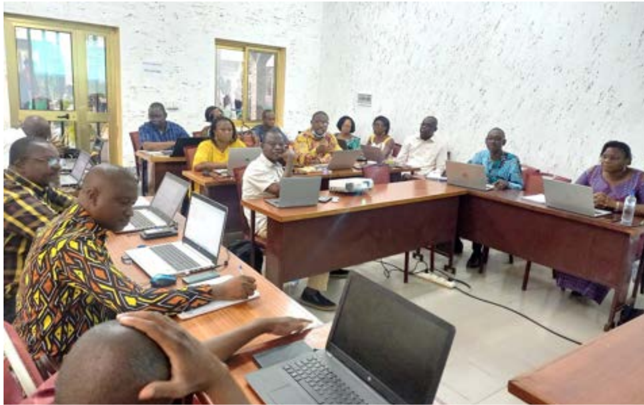
Le projet d'arrêté a été passé au peigne fin par les participants

L'atelier s'intègre dans une vision de mutualisation de bonnes pratiques de l'ADCT des projets et programmes pour la production d'un référentiel national. Les innovations portées par la CADEPAC lors de la mise en œuvre des deux premières phases du programme décentralisation et participation citoyenne (DEPAC), financé par la Coopération Suisse s'inscrivent dans cette dynamique. Parmi ces innovations, il y a la démarche d'auto-évaluation qui est une approche innovante de mesure des performances des Collectivités Territoriales, développée dans sa zone d'intervention, en vue de permettre à ces CT de prendre de bonnes décisions pour améliorer la gouvernance locale.