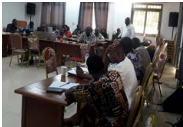
Les participants ont été formés sur la MOPLT et la gestion financière des projets

Le Consortium GAC à travers son unité opérationnelle, la CADEPAC, a organisé une formation sur la MOPLT, la gestion financière des projets du 19 au 21 juillet 2023, à Fada N'Gourma. C'était au profit de trente-et-un (31) acteurs