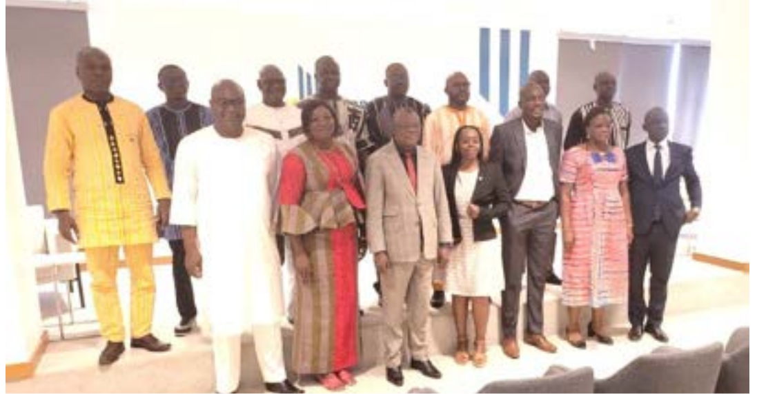
Photo de famille de la délégation burkinabè et rwandaise

ainsi que la politique de décentralisation fiscale et les mécanismes de financement des collectivités locales.