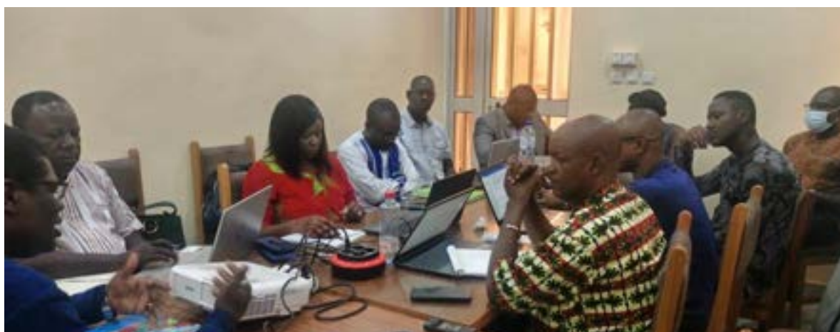
Les experts ont été formés pour être plus opérationnels sur le terrain

connaissances et expériences sur la MOPLT et sur le nexus HDP qui diffèrent dans les quatre (04) régions d'intervention du programme. Ce fut un moment de renforcement de la cohésion entre les travailleurs de la Cellule d'Appui à la Décentralisation et à la Participation Citoyenne (CADEPAC).