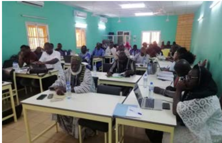
Le comité de suivi en plein examen du contenu de la S-DELCoT de la région du Nord

Après le lancement des travaux de validation de la Stratégie de Développement Economique et Cohérence Territoriale (S-DELCoT) de la région du Centre-Ouest, c'était au tour des acteurs de la région du Nord de valider leur document, du 22 au 23 mai 2023. La rencontre a réuni quarante participants (30 hommes et 10 femmes) pendant quarante-huit (48) heures. Au cours des travaux le comité de suivi a présenté la synthèse des travaux de l'atelier de Koudougou, examiné et amendé le contenu de la S-DELCoT de la région du Nord ; avant d'être validé par les parties prenantes. Aussi, ce fut le lieu de définir une feuille de route pour son adoption par la Délégation Spéciale Régionale.