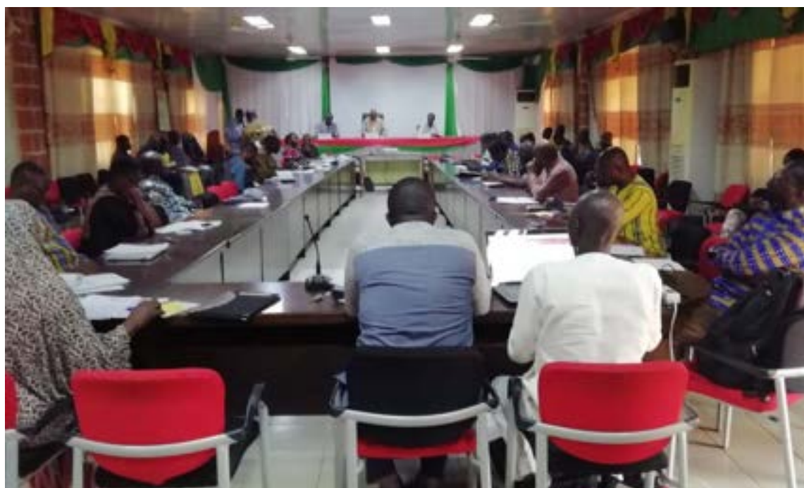
La S-DELCoT du Nord a été adoptée à l'unanimité par la délégation spéciale régionale

création d'emplois, le développement des infrastructures de soutien à la promotion des filières et la promotion de la cohérence territoriale et la gouvernance dans un environnement de sécurité et de paix. En rappel, son