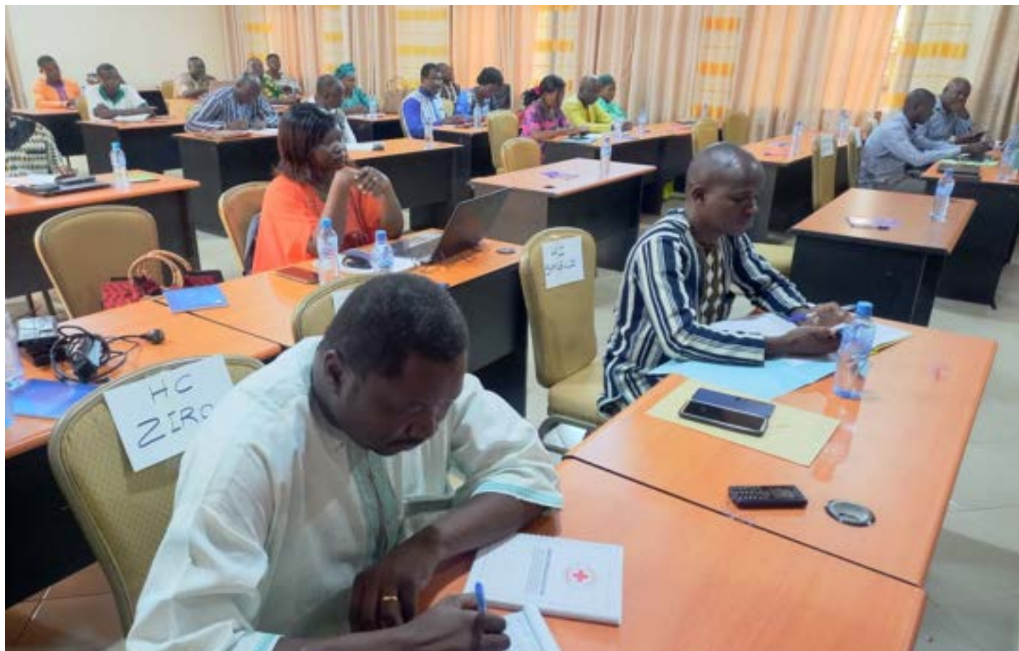
Les participants ont pu cerner les contours de la MOPLT en lien avec le nexus HDP

Développement et Paix), qui constitue l'un des défis du moment.