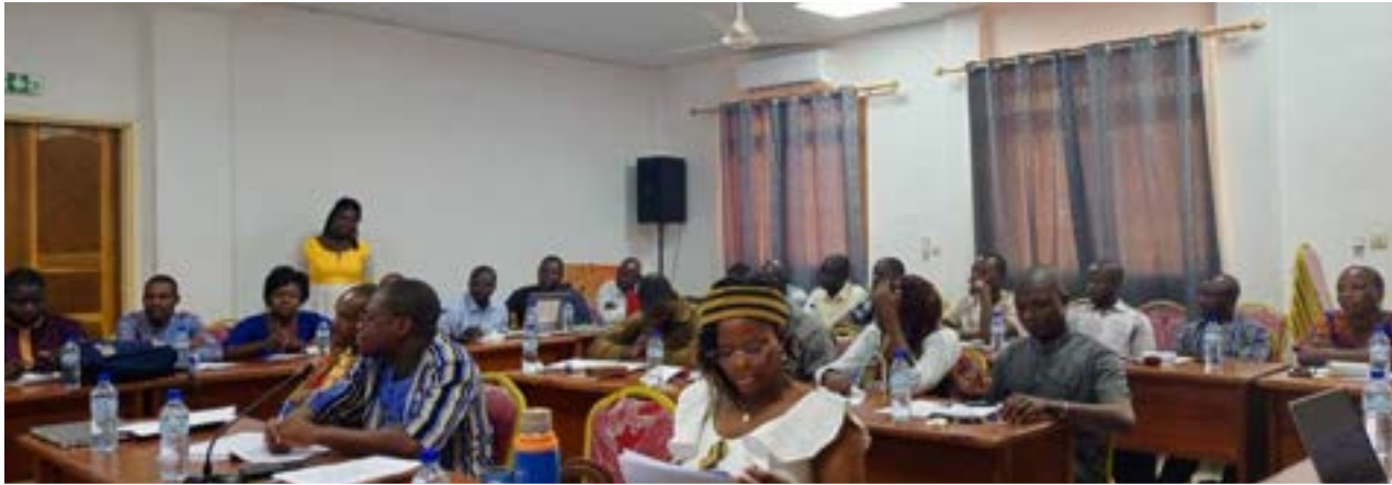
Les acteurs techniques des CT partenaires de la Tapoa et de la Gnagna, formés pendant 72h