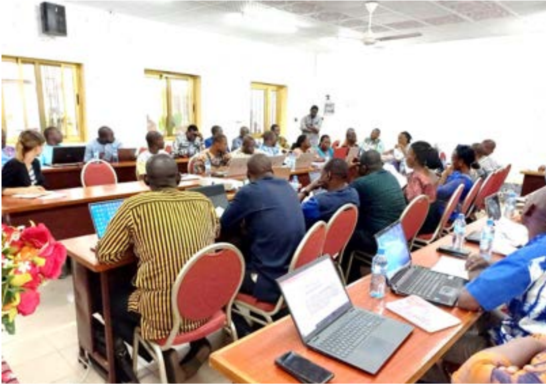
Les participants en séance d'échanges à l'issue de la présentation des innovations

La Cellule d'Appui à la Décentralisation et à la Participation Citoyenne (CADEPAC) a tenu un atelier de partage des innovations portées par les mandataires du programme DEPAC, avec les structures du Ministère de l'Administration Territoriale, de la Décentralisation et