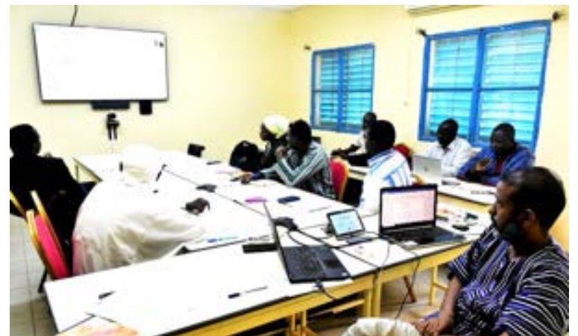
Dans le Sahel, les acteurs ont participé à la formation par visioconférence

Les principes d'intervention du DEPAC-3, les approches AMO et MOPLT développée par la CADEPAC et l'approche HDP et celle inclusive du LNOB ont été présenté. Aussi, les rôles et responsabilités des acteurs du processus de mise en œuvre d'un projet, les procédures de gestion financière et de redevabilité ont aussi été abordés.