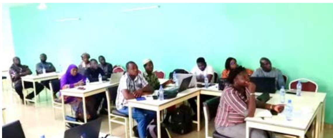
Les acteurs techniques des CT sont repartis outillés sur la MOPLT et l'instruction technique et financière des projets

Cet atelier de la CADEPAC s'est tenu dans le cadre de la mise en œuvre du DEPAC-3, financé par le Coopération Suisse.