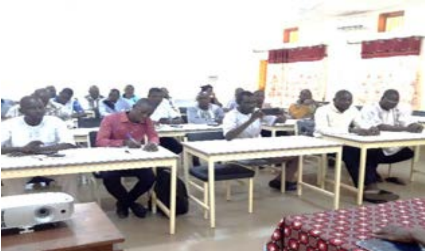
L'atelier d'informations et de formations des acteurs de la Tapoa et de la Gnagna

A travers ces ateliers, les participants ont pu s'approprier de l'approche d'accompagnement développée par le Consortium GAC dans la mise en œuvre de l'axe 2 du DEPAC-3, ainsi que les rôles et responsabilités de chaque acteur dans l'exercice de la MOPLT, en lien avec les contextes sécuritaire et humanitaire dans la région de l'Est.