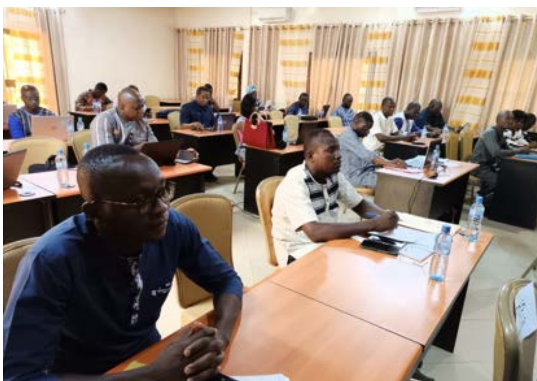
Les participants ont parcouru le rapport provisoire de la S-DELCoT du Centre-Ouest

du Centre-Ouest a été réexaminé les 22 et 23 mai 2023 dans la Commune de Réo, Province du Sanguié. Cet atelier a permis de relancer le processus d'élaboration de la S-DELCoT de la région du Centre-Ouest, d'examiner le rapport provisoire du document, de faire