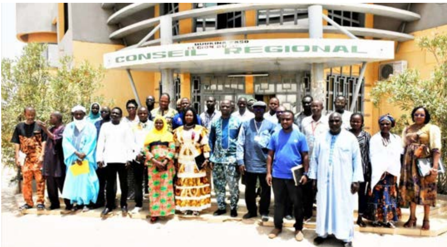
Photo de famille des participants avec les représentants des trois (3) mandataires du DEPAC-3

Les axes d'intervention de la CADEPAC et ceux des deux (02) autres mandataires ont également été présentés. En prélude à ce lancement, une délégation des mandataires du DEPAC-3 a rendu visite au Président de la Délégation Spéciale (PDS) régionale du Sahel et au premier vice-président de la délégation spéciale de la commune de Dori, le 16 mai 2023.