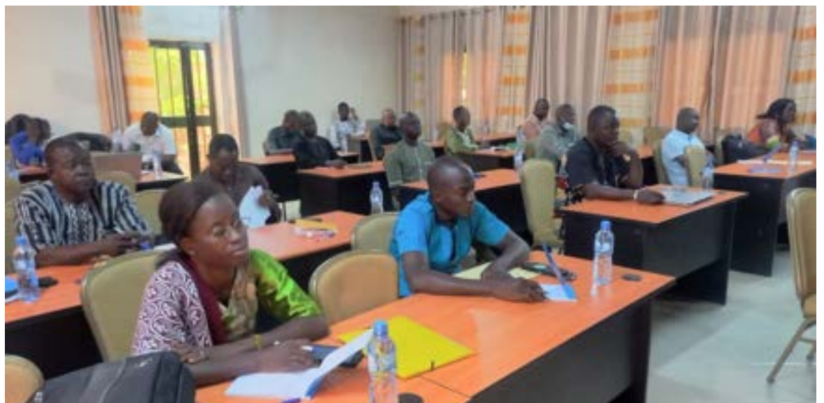
Les participants ont pu s'approprier les outils techniques et financiers liés à la MOPLT

l'approche Humanitaire-Développement-Paix (HDP). L'atelier s'est tenu dans le cadre de la mise en œuvre du DEPAC-3, financé par le Coopération suisse.