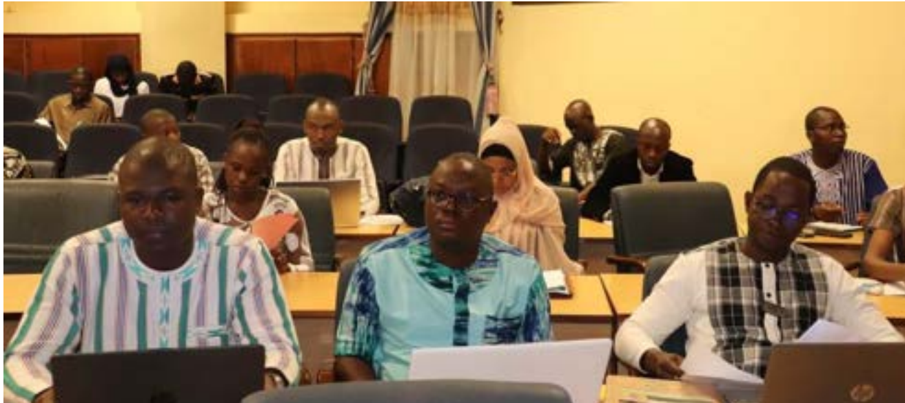
Les participants ont procédé à la validation du projet de décret

Il ressort que le projet de décret comporte quarante-quatre (44) articles regroupés en onze (11) chapitres qui traitent des dispositions générales, du cadre de gouvernance, de la planification des projets, de la procédure de passation, de l'offre spontanée, de la signature et de l'approbation des contrats, du bouclage financier et démarrage des travaux et de l'exploitation, du contenu et exécution du contrat, des modalités de gestion et de contrôle du contrat, du règlement des différends ainsi que dispositions spécifiques et finales.