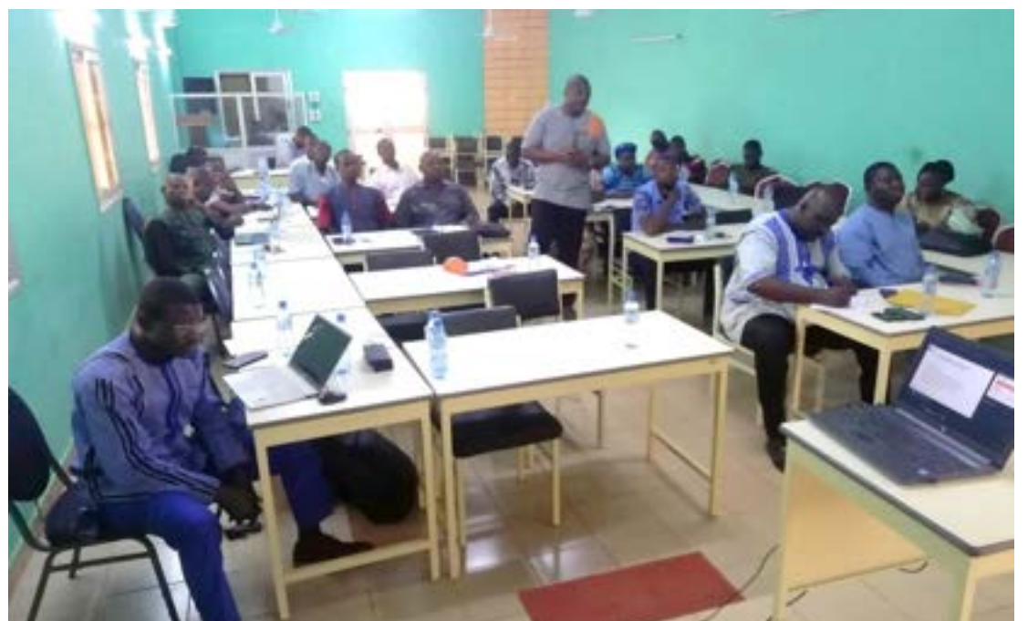
Les participants sont repartis outillés sur la MOPLT en lien avec le nexus HDP

C'était le lieu pour les trente-huit participants (30 hommes et 08 femmes) de connaître leur rôle dans le processus de mise en œuvre des activités de développement local dans ce contexte sécuritaire et humanitaire difficile.