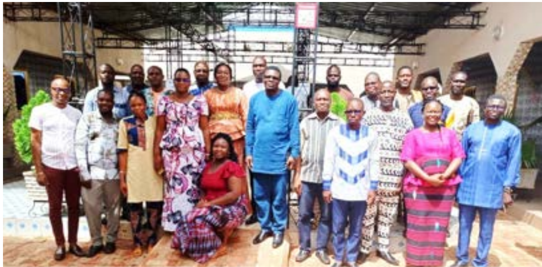
Photo de famille des participants à l'atelier

structures nationales concernées par cette thématique (DGCT et ADCT) conviennent d'une synergie.