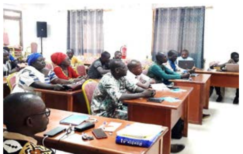
... les acteurs du Gourma

Ces rendez-vous ont vu les capacités des acteurs locaux des CT partenaires de l'Est renforcées sur les principes d'intervention, l'organisation et les approches développées par le programme DEPAC-3. Un accent particulier a été mis sur les types d'accords existants entre l'Etat, les mandataires et la