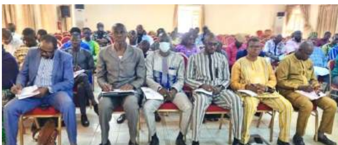
Les acteurs de la région du Nord ont assisté à la présentation des enjeux de la stratégie

Pour présenter le contenu de sa stratégie adoptée par la délégation spéciale le 22 juin 2023, le Conseil Régional du Nord a organisé le jeudi 08 février 2024, à Ouahigouya, un atelier de diffusion de la S-DELCoT pour mettre au même niveau d'information tous les acteurs décentralisés des