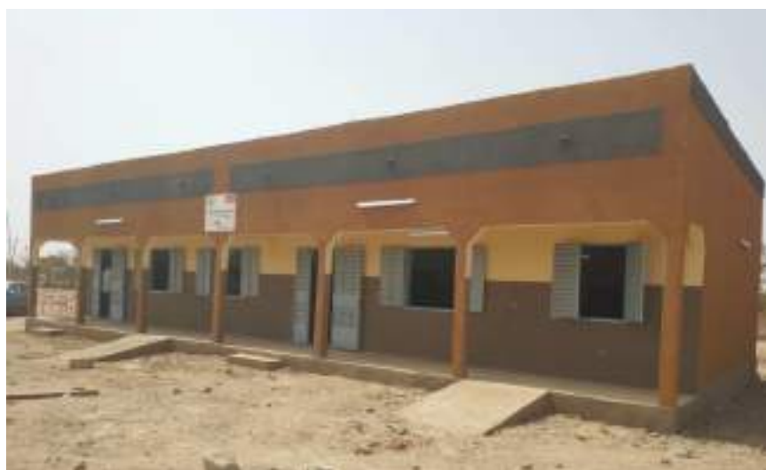
02 salles de classes construites au Lycée départemental de Sapouy (Centre-Ouest)