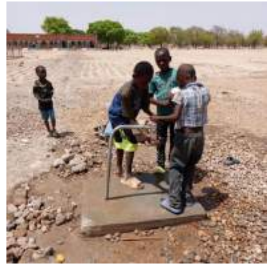
Transformation d'une pompe à motricité humaine en un poste d'eau autonome avec raccordement, à l'école Tambissini de Tibga