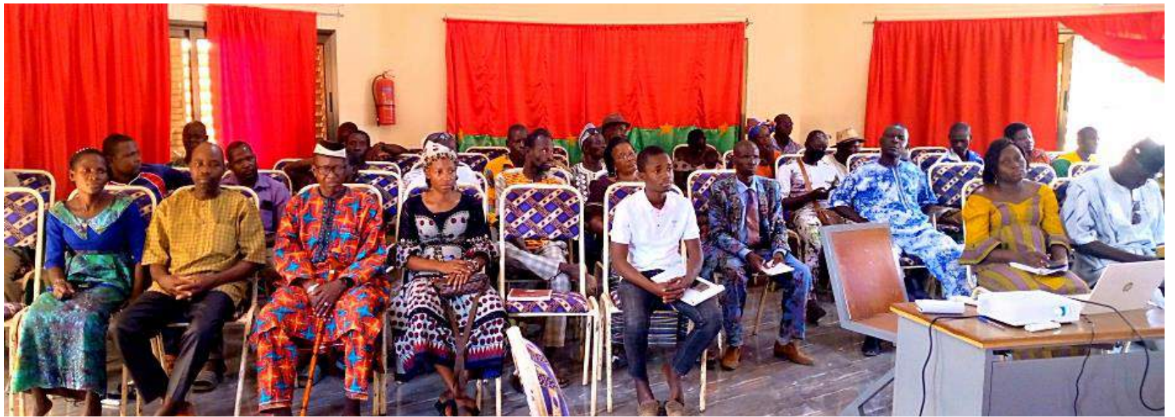
Atelier de restitution des résultats de l'auto-évaluation de la commune de Kordié (Sanguié)

Après les exercices réussis de l'auto-évaluation des performances des CT partenaires du programme DEPEC de l'année 2022, la CADEPAC dans une logique de continuité a accompagné ces