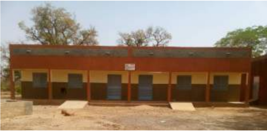
02 salles de classes construites à l'école primaire de Latuy, à Kordié (Centre-Ouest)