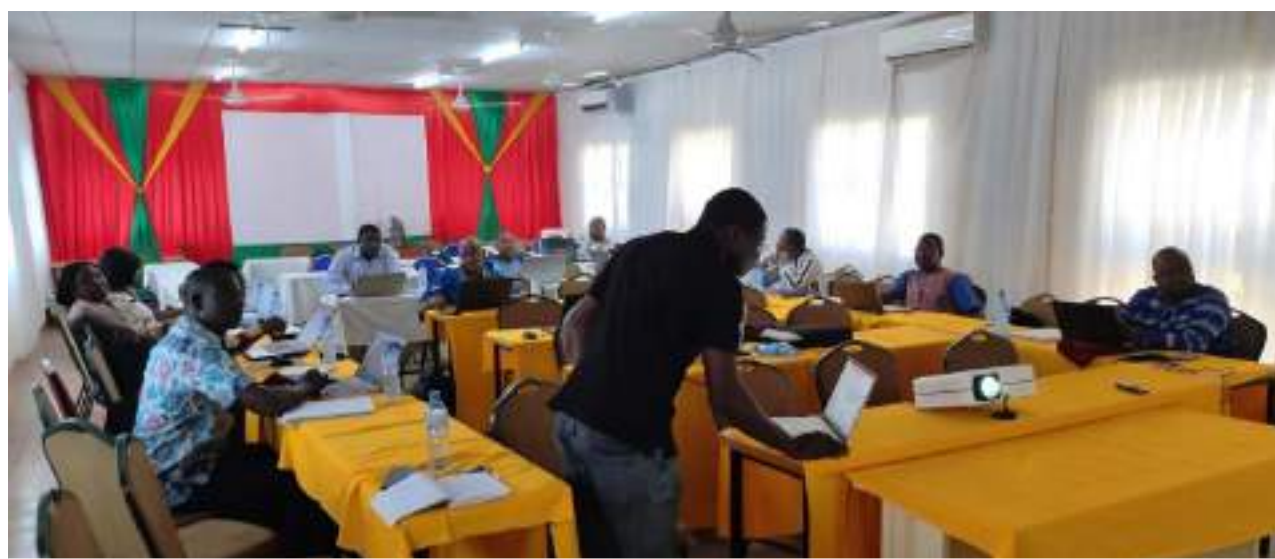
L'atelier a permis de valider le rapport préliminaire à l'interne

Il ressort de cet atelier que le rapport a permis de réaliser une description synthétique accompagnée d'une cartographie des innovations développées par chaque PTF. Mieux, il a ressorti une analyse de la cohérence des approches/innovations et leur complémentarité éventuelle. Des amendements ont été faits directement dans le document et des recommandations ont été formulées pour une mise en cohérence des approches des PTF proposées, afin de dégager les similitudes et les divergences.