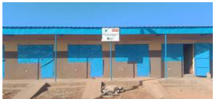
Des boutiques de rue réalisées par la commune de Ouahigouya (Nord)

Pour les PAI 2024 des CT, la conduite du processus de pré-identification des projets d'investissement socio-économique est engagée. La note technique relative aux droits de tirage 2024 a été faite et validée par la DDC. Ladite note a fait l'objet d'un partage avec l'ADCT, en vue de renforcer la synergie et la mutualisation des ressources au profit de projets locaux.