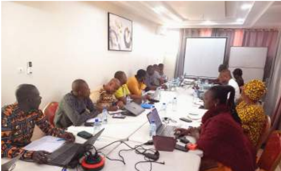
Le PTBA de 2023 révèle un taux de réalisation des activités de 92%

Après une année de mise en œuvre de la phase 3 du programme DEPAC financé par la Coopération suisse, l'équipe opérationnelle du Consortium GAC a fait une halte, le mardi 20 février 2024, à Koudougou, pour faire le bilan de la mise en œuvre de son Plan de Travail et Budget Annuel (PTBA) de l'année 2023.