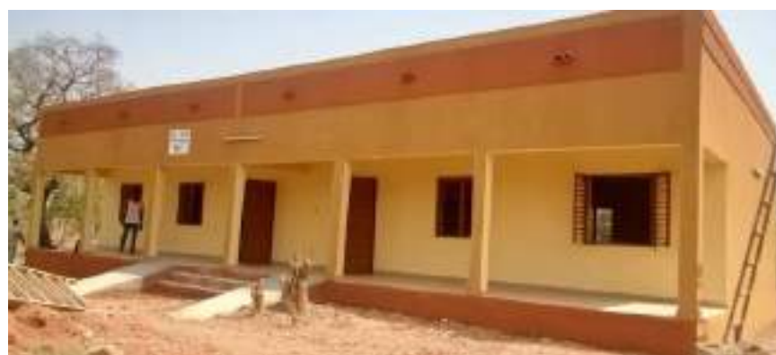
02 salles de classes construites au lycée "Professionnel Maurice YAMÉOGO" de Koudougou par le Conseil Régional