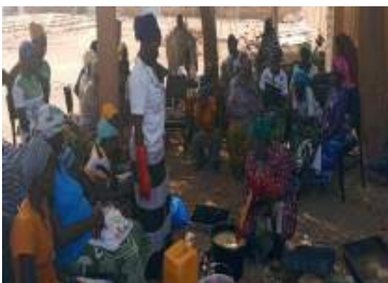
50 femmes PDI de la commune de Maticoaali formées en saponification, et dotées en matériel