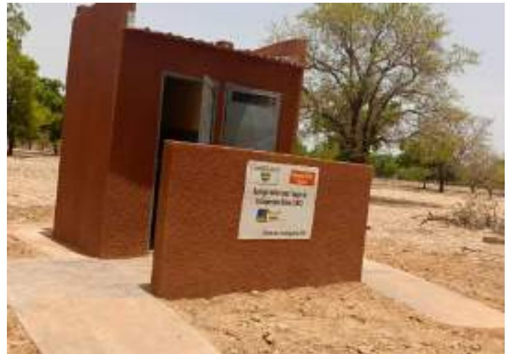
01 forage positif équipé d'une pompe à motricité humaine et 01 bloc de latrine VIP à deux postes au profit des PDI du village de Dianzoé (Sapouy)