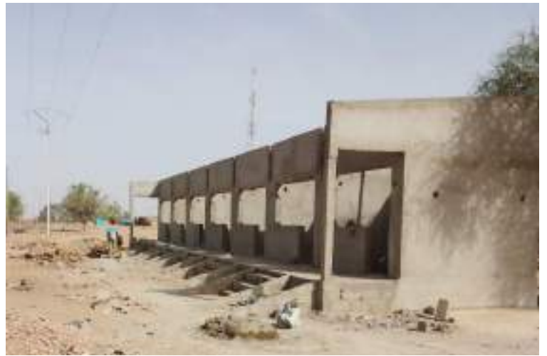
Chantier de construction de boutiques de rue à Wendou (Dori)