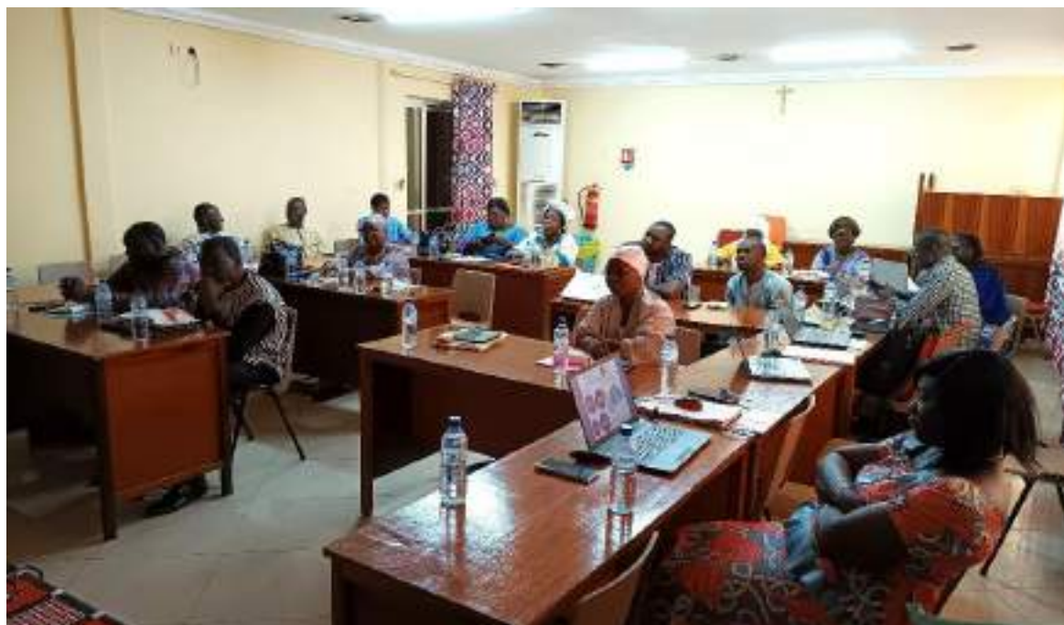
Les OSP retenues sont issues des régions du Centre-Ouest, de l'Est, du Nord et du Sahel

https://civitac.org/spip.php?article3751