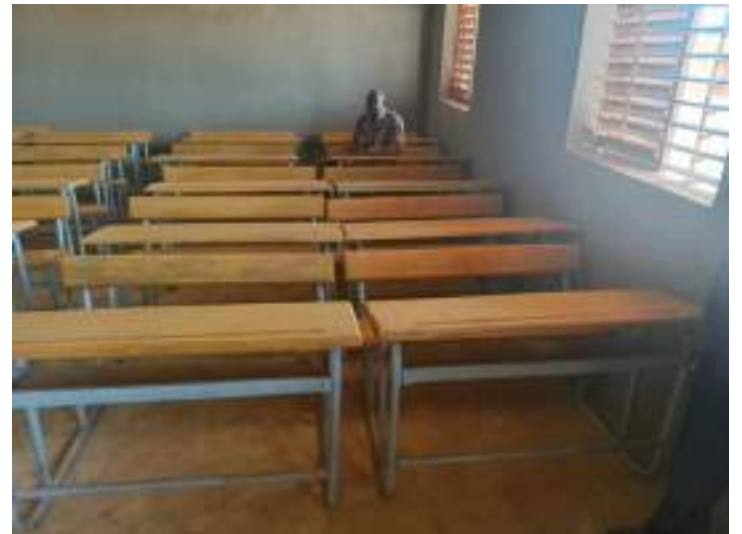
20 tables-bancs acquis au profit des CEB 1 et 2 de Ouahigouya