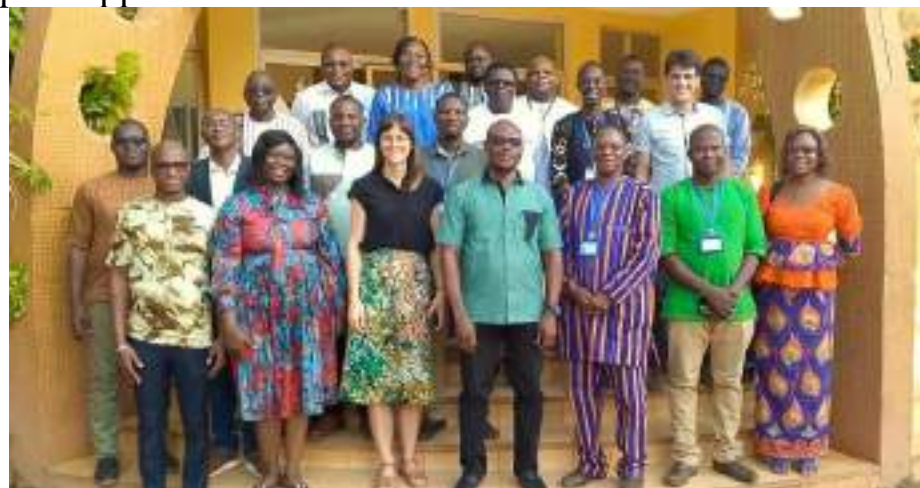
Photo de famille de l'équipe de la DDC avec les mandataires du programme DEPAC

Axe 2 : « Assistance à la planification économique et à la maîtrise d'ouvrage des collectivités territoriales, y inclus leur capacité de réponse aux défis humanitaires ainsi que l'appui à l'ADCT ».