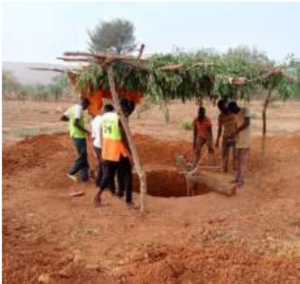
Travaux d'aménagement d'un (01) hectare de périmètre maraîcher à Pella (commune de Samba), par le conseil régional du Nord