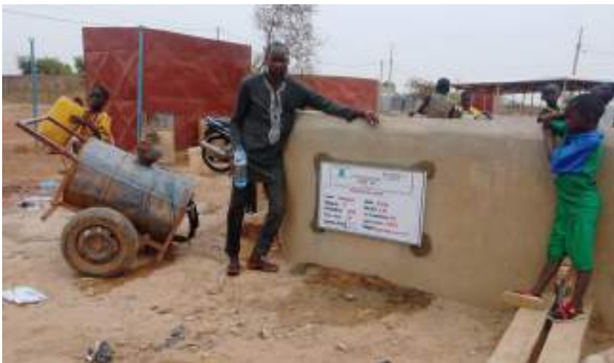
01 forage positif réalisé sur le site PDI de Gourga, Ouahigouya