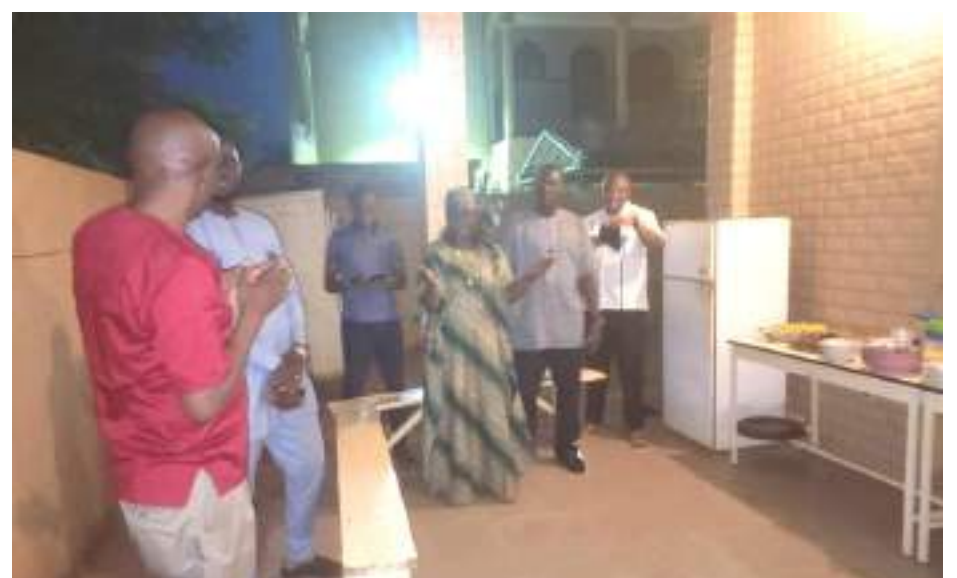
Une rupture collective symbole de tolérance religieuse

Ce fut le lieu pour le premier responsable de partager un