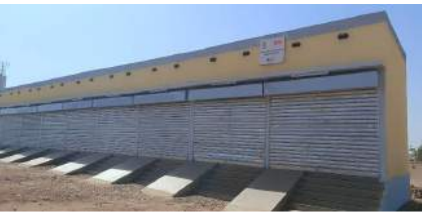
Des boutique de rue réalisées par le Conseil régional du Nord à la salle polyvalente de Ouahigouya (Nord)