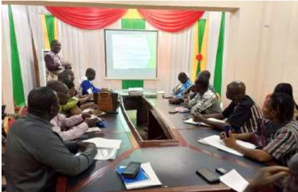
Les participants ont également assisté à la présentation du plan d'entretien consolidé (PEC) de la commune

La commune de Koudougou, pour assurer les entretiens périodiques, courants et les grosses réparations dans les secteurs de l'éducation, la santé, l'eau potable et des équipements marchands, s'est dotée d'un Plan d'Entretien Consolidé (PEC), un outil de planification qui couvre la période de 2021-2025. Ce qui a prévalu à la mise en place par arrêté communal d'un COGEM (Comité Gestion-Entretien-Maintenance) de la commune de Koudougou. C'est à l'effet de garantir un meilleur entretien de ces réalisations que cette rencontre de concertation avec les acteurs de l'éducation, de la santé, des équipements marchands et de l'eau