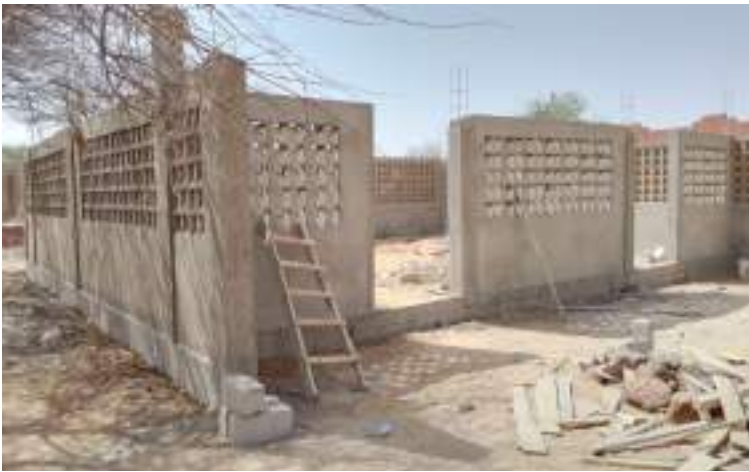
Chantier de construction d'un hall d'attente au Centre Médical Urbain de Dori, par le Conseil Régional