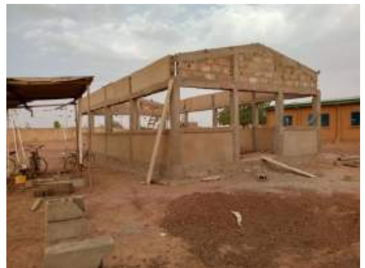
Travaux de construction de 02 halls au centre médical urbain de Titao