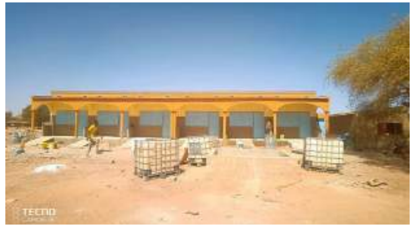
Des boutiques de rue construites au secteur n°2 de Bogandé (Région de l'Est)