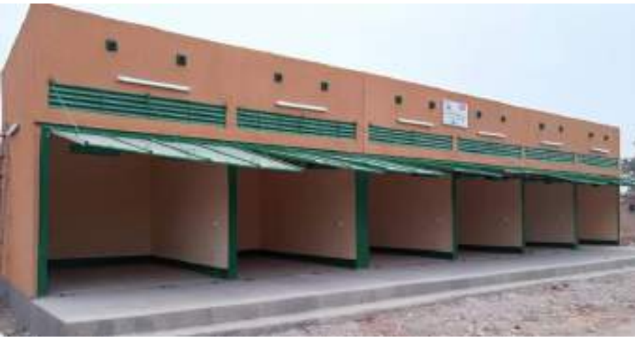
Des boutiques de rue construites au secteur 30 de la commune Fada N'Gourma (Région de l'Est)