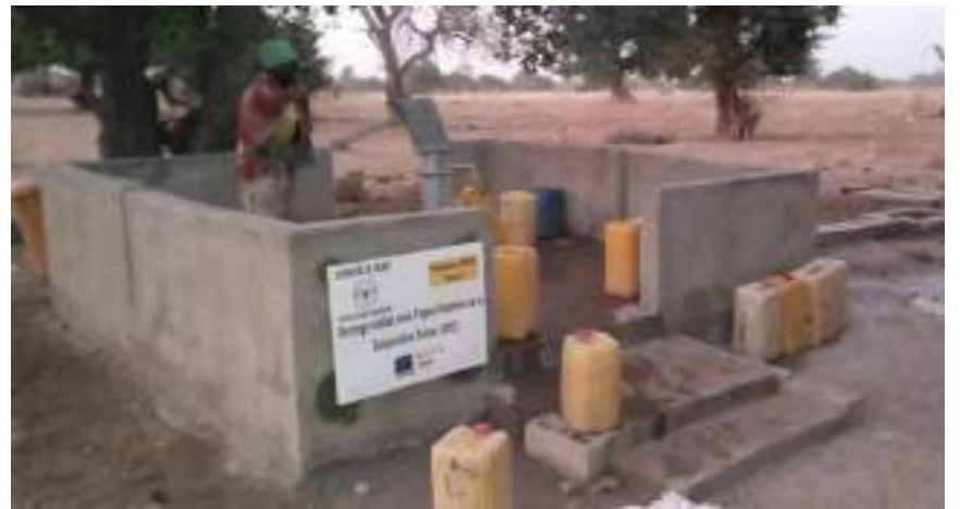
Un forage réalisé dans le village de Dabesma, commune de Manni (Région de l'Est)