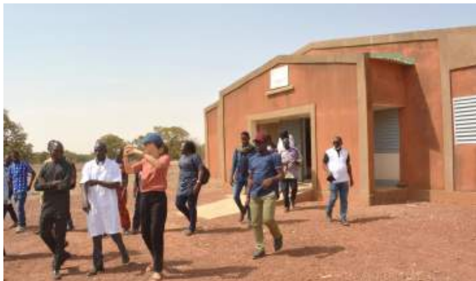
La délégation à l'étape de la visite du CSPS de Yaoghin, à Poa

Une délégation de la Direction du Développement de la Coopération suisse (DDC) au Burkina Faso accompagnée des mandataires du programme d'appui à la Décentralisation et Participation Citoyenne (DEPAC) ont effectué une mission de suivi/supervision des activités, le mardi 30 janvier 2024, à Koudougou et Poa. À Koudougou, la mission a échangé avec une équipe de la délégation spéciale régionale du Centre-Ouest sur les acquis du