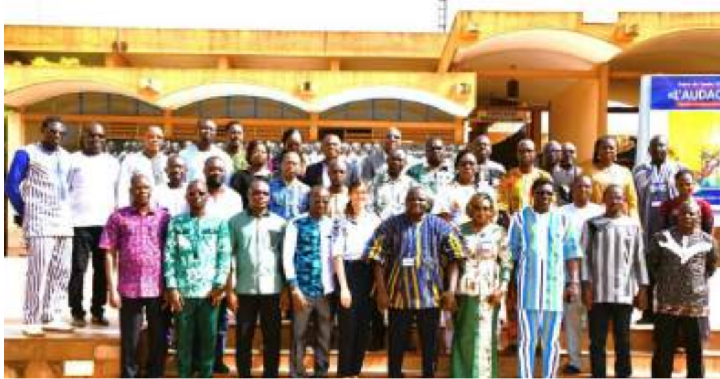
Les travaux ont abouti à l'homologation des modules de formation

des cadres de ministères, du personnel de projets et programmes, des structures ou institutions spécialisées, et des organisations de la société civile (OSC), le comité s'est réuni du 15 au 20 avril 2024, à Ouagadougou, afin d'examiner les modules soumis à son appréciation.