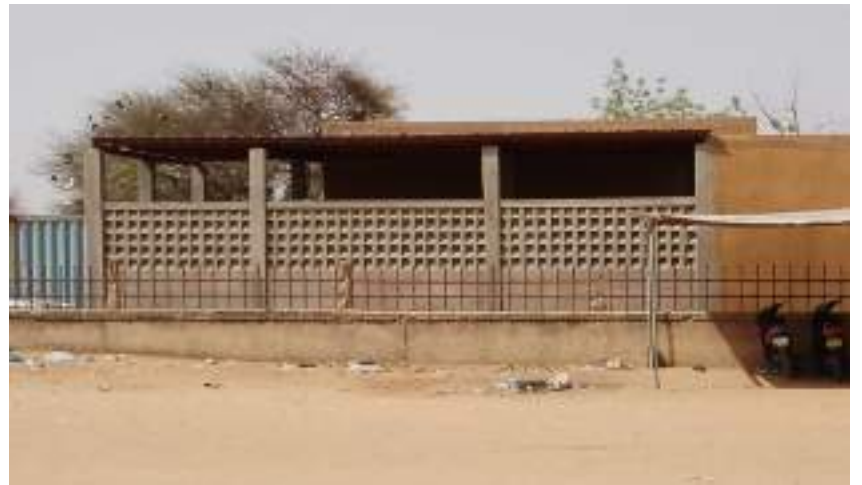
Chantier de construction d'un hall d'attente au Centre médical des forces vives de Dori