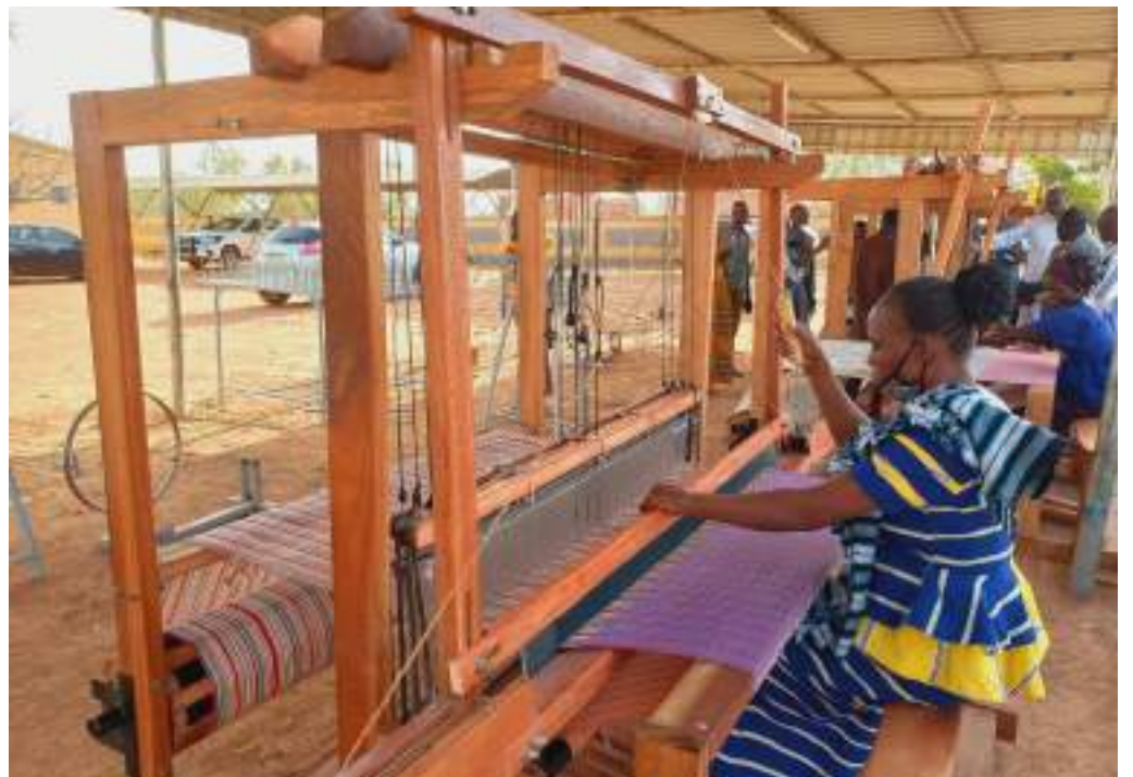
Ces métiers à tisser viendront accroître la capacité de production des bénéficiaires

Cette activité entre aussi dans le cadre de la mise en œuvre de la Stratégie de développement économique et cohérence