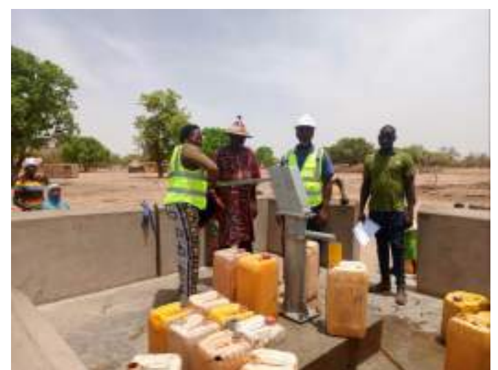
01 forage positif réalisé à Tankibargou (Fada N'Gourma)