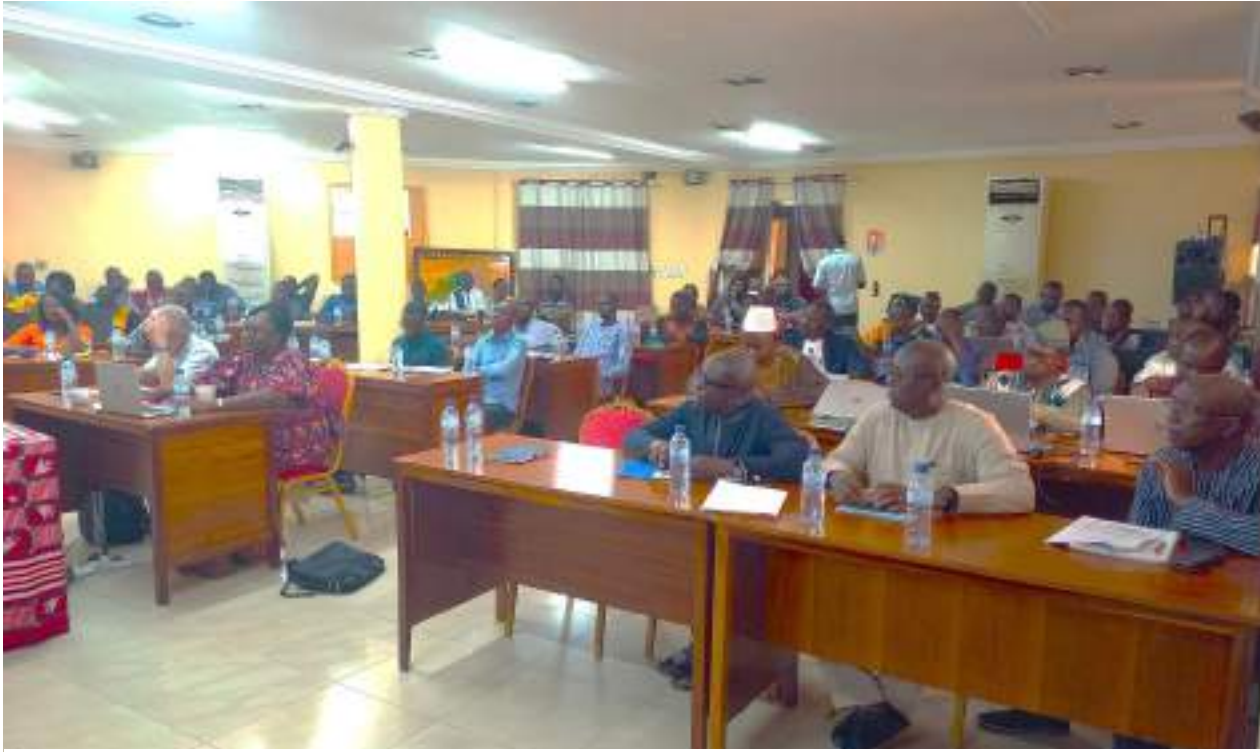
Une vue des participants à l'atelier de Ouagadougou

Au titre des PAI 2023, les collectivités territoriales partenaires du DEPAC ont bénéficié de droits de tirage pour la réalisation d'infrastructures socio-économiques. Après une première année de mise en œuvre des investissements, il est opportun de faire un bilan pour tirer les enseignements en vue d'améliorer la qualité des projets d'investissement.