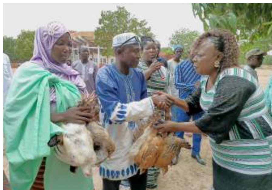
43 couples de PDI ont reçu chacun 10 poules et 1 coq

La cérémonie de remise s'est tenue le vendredi 26 juillet 2024 à Koudougou. Elle a été le lieu pour les bénéficiaires de recevoir 430 poules et 43 coqs, soit 10 poules et 1 coq,