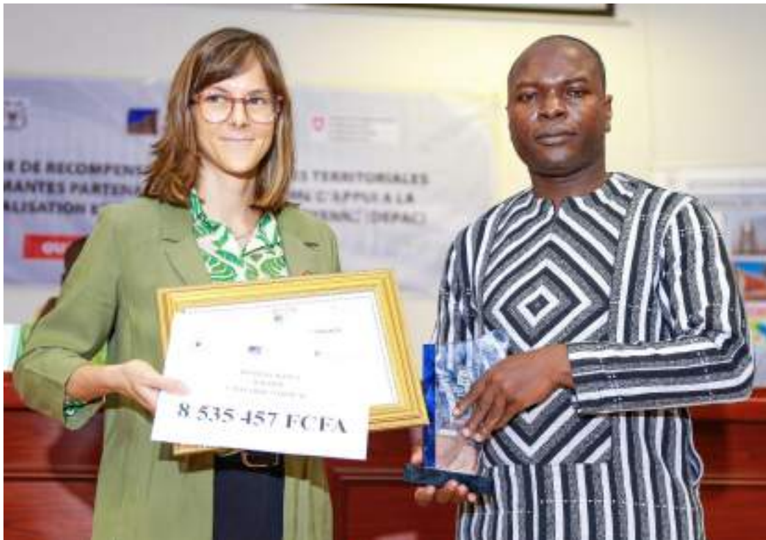
La commune de Koudougou placée première reçoit son prix

En vue de récompenser les collectivités territoriales performantes, la CADEPAC a organisé une cérémonie de récompense et d'octroi de bonus, le mardi 16 juillet 2024, à Ouagadougou. La cérémonie présidée par le Directeur Général des Collectivités Territoriales (DGCT), représentant le Ministre de l'Administration Territoriale, de