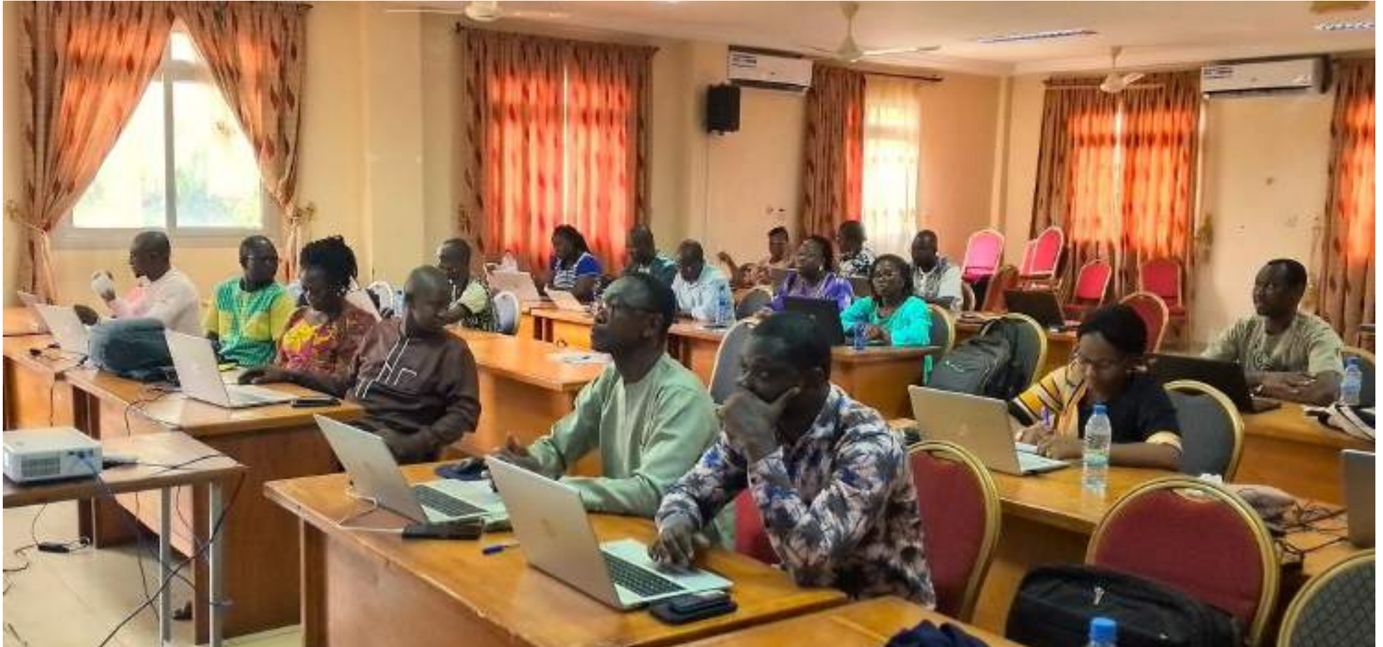
Ce guide fera partie de la banque d'outils national à disposition de l'appui-conseil des CT dans la mise en œuvre des divers projets d'investissements

La réduction des inégalités de genre demeure une préoccupation nationale surtout dans ce contexte de crise sécuritaire. Afin de mieux accompagner les Collectivités Territoriales (CT) et les communautés à la base dans la réalisation de leurs projets de développement genre sensible, l'Agence nationale d'Appui au Développement des Collectivités Territoriales (ADCT), dans le cadre de la mise en œuvre des activités du Guichet d'Appuis Techniques (GAT) et de sa banque d'outils, a organisé un atelier d'élaboration d'un guide pour la prise en compte du Genre dans ses interventions du 06 au 10 mai, 2024 à Koudougou.