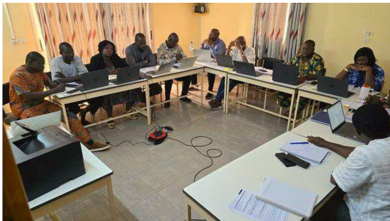
L'équipe de la CADEPAC a passé en revue les activités du trimestre à venir

La CADEPAC, consciente que la réussite de l'ensemble de ses projets passe inexorablement par une bonne planification, a inscrit les réunions hebdomadaires