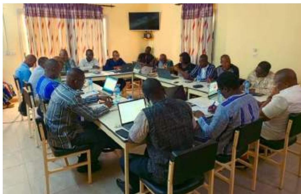
Les PDS des CT partenaires du Nord et de l'Est en séance de travail avec l'équipe de la CADEPAC

En rappel, il faut noter que malgré le contexte sécuritaire difficile que vivent les CT de sa zone d'intervention, la CADEPAC demeure aux côtés de celles-ci, afin de leur permettre de réaliser des investissements au profit des populations grâce aux outils et stratégies résilients développés dans le cadre de la MOPLT.