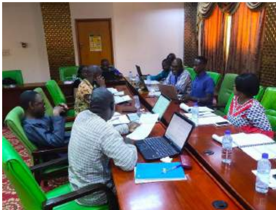
L'atelier a permis aux consultants de restituer les résultats de l'étude aux participants

La restitution de l'étude portant sur l'inventaire et la cartographie des approches, innovations et outils en matière d'exercice de maîtrise d'ouvrage et de la gouvernance locale, développés par les Partenaires Techniques et Financiers (PTF) de la décentralisation dans les collectivités territoriales, est intervenue en marge d'un atelier, tenu le 14 mai 2024, à Ouagadougou.