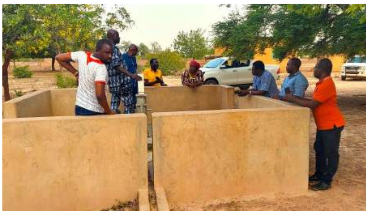
La mission visite un forage dans la région du Nord

Dans la région du Nord, tout comme à l'Est, l'équipe de la CADEPAC était accompagnée par l'antenne régionale de l'ADCT. Cette sortie qui intervient dans le cadre de la synergie d'actions entre la CADEPAC et l'ADCT a permis d'échanger avec le président de la délégation spéciale régionale du Nord et les présidents des délégations spéciales de ses communes partenaires de la région. À l'issue de ces échanges, la délégation a visité des réalisations au titre des