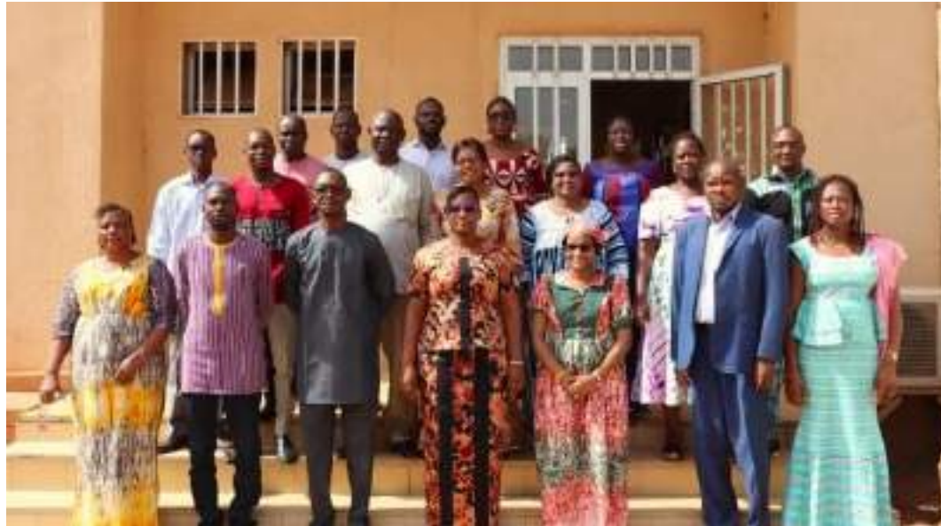
Photo de famille des participants

La Cellule d'Appui à la Décentralisation et à la Participation Citoyenne (CADEPAC), dans le cadre de la mise en œuvre du DEPAC-3, a appuyé l'organisation dudit atelier qui a réuni une quarantaine de participants.