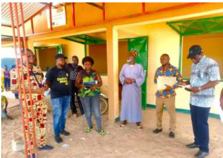
À l'Est, la mission a visité plusieurs réalisations

La mission était en compagnie de la Coopération Intercommunale pour le Développement des Communes de l'Est (CIDCE). Dans les communes de Tibga, Fada