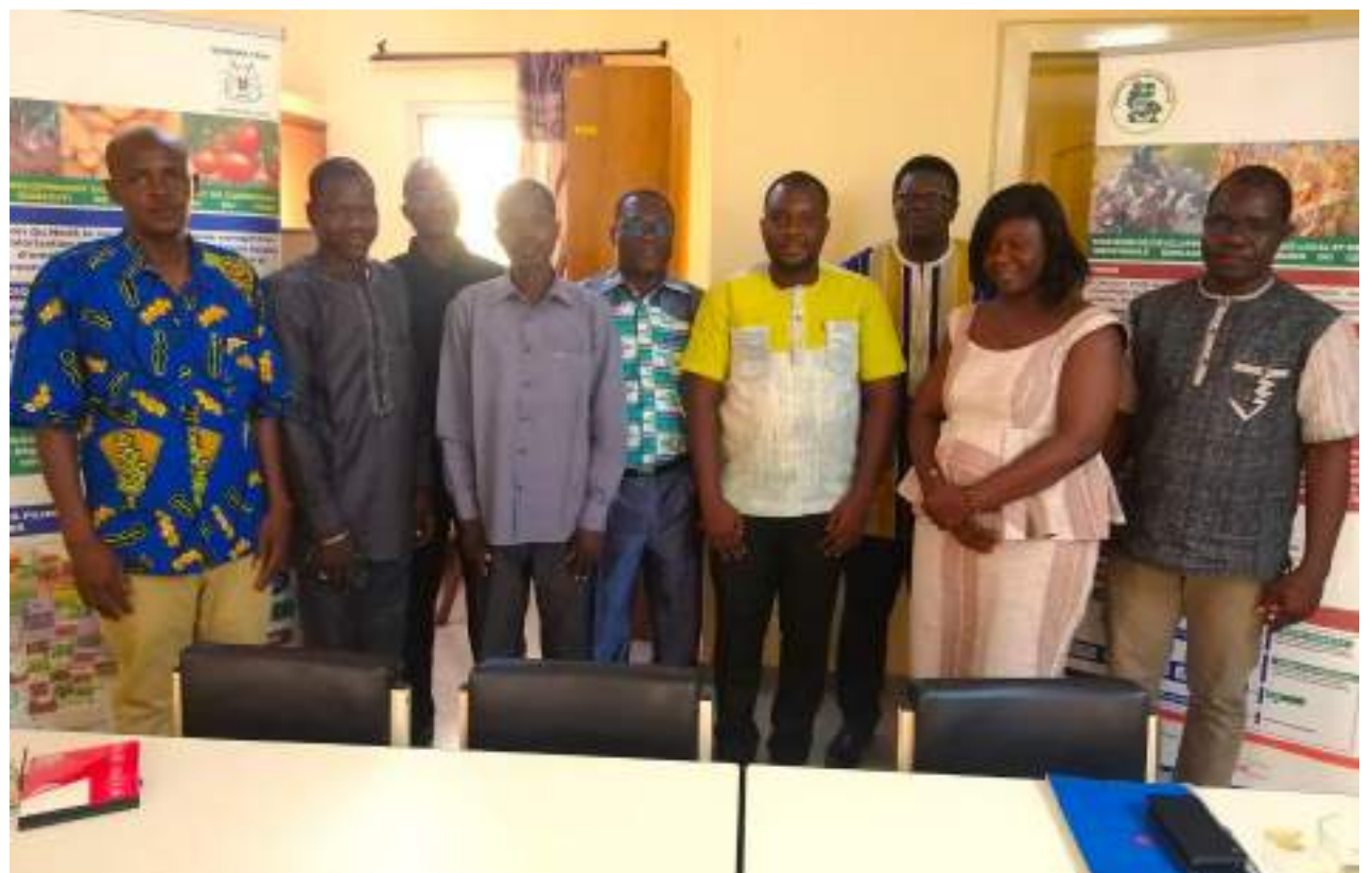
Photo de famille des participants à la rencontre

Afin de mieux échanger sur la mise en œuvre de la stratégie et des investissements à réaliser au titre du PAI 2024, la CADEPAC a échangé avec les secrétaires généraux et directeurs des affaires économiques des conseils régionaux des deux (02) régions, le mardi 4 juin 2024 à Ouagadougou.