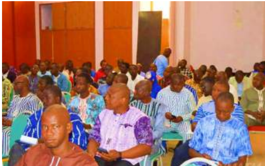
Une vue des participants à l'atelier de Bobo Dioulasso

La Direction Générale des Études et des Statistiques Sectorielles (DGESS) du ministère en charge de la décentralisation en partenariat avec la CADEPAC a organisé deux (2) ateliers de diffusion des expériences développées par le Consortium GAC dans le domaine de la décentralisation. La diffusion de ces expériences a été partagée avec les acteurs