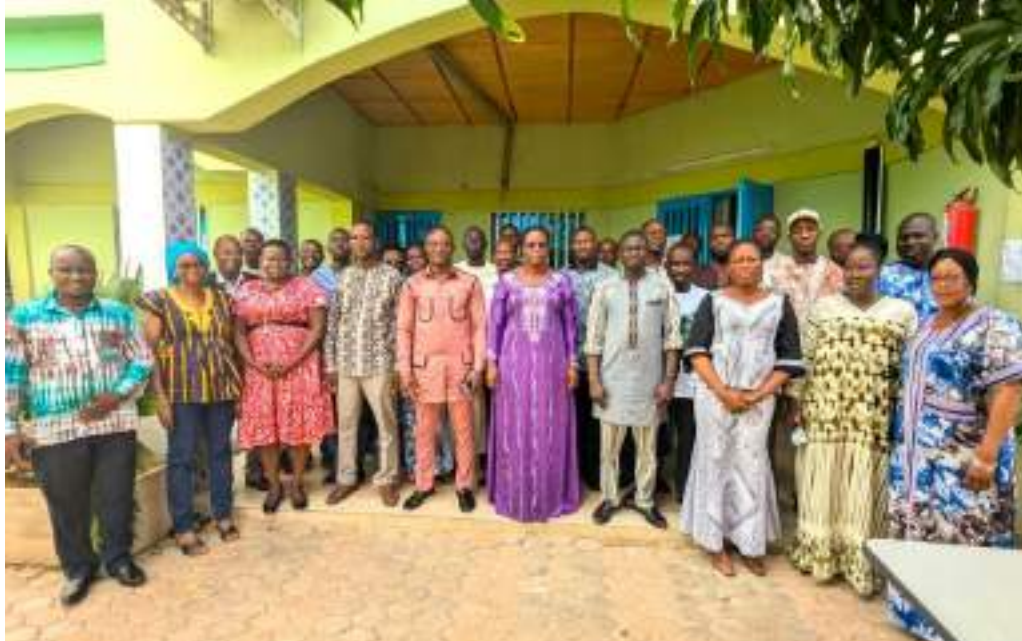
Photo de famille des participants à l'atelier

avec les structures d'inter-collectivités sur les possibilités de partenariats et d'accompagnement, dans le cadre du Guichet Appuis Techniques (GAT) de l'ADCT, du 31 juillet au 03 août 2024, à Manga, dans le Centre-Sud.