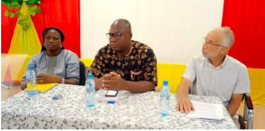
La rencontre a permis aux structures centrales étatiques de présenter leurs bilans de la feuille de route 2023

Dans le cadre de la mise en œuvre des programmes DEPAC-3 et SYAND, les structures centrales de l'État (DGCT, SP-CONAD, DGESS, ADCT, DGDT, ENAM) et les mandataires de DEPAC (Laboratoire Citoyennetés et Consortium